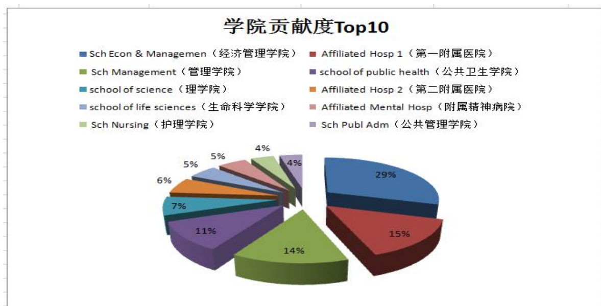
图 4.1 南昌大学 SSCI 发文量 Top10 学院贡献度