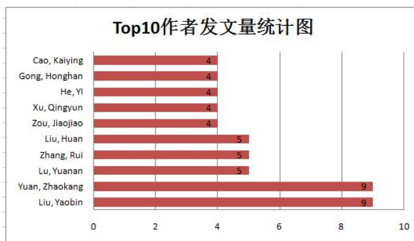
图 3.1 南昌大学 SSCI 发文量 Top10 作者统计图

从图 3.1 可以看出,最高发文量有两位作者,分别为来自经济管理学院的刘耀彬教授和公共卫生学院的客座兼职教授 Lu, Yuanan,